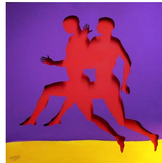
Attika Tecnica mista cm. 100x100