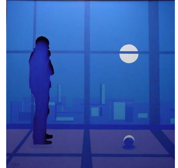
Pensieri notturni Tecnica mista cm.100x100