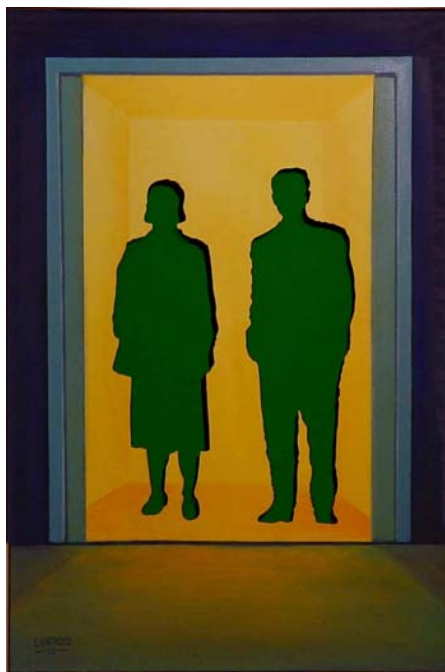
Ultimo piano Tecnica mista cm. 60x100