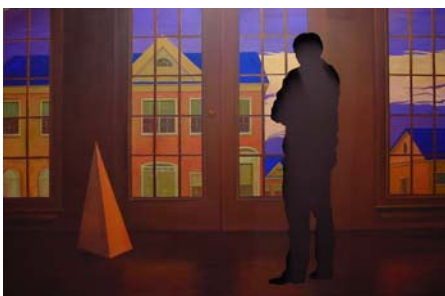
La piramide Tecnica mista cm. 150x100